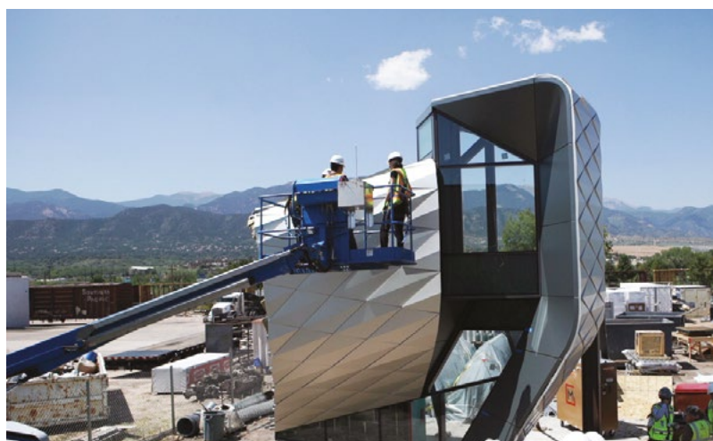
Image du haut : tous les bardeaux de la façade du Musée olympique ont une taille ou une forme différentes.

Image du bas : MG McGrath a utilisé la plate-forme 3DEXPERIENCE pour tenir toutes les parties impliquées au courant de l'évolution de la conception et de la construction de la façade.