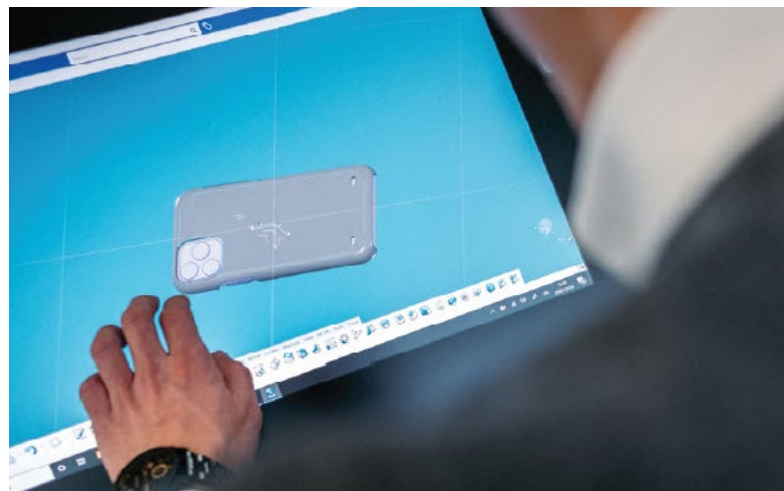
상단 이미지: 다양한 금속 및 비금속 액세서리 - AMF 설계