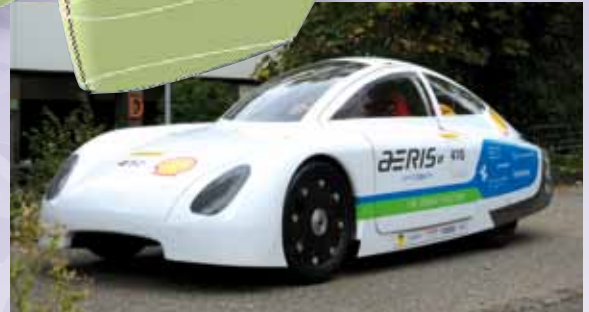
Aeris Testfahrt am Campus der FH Trier