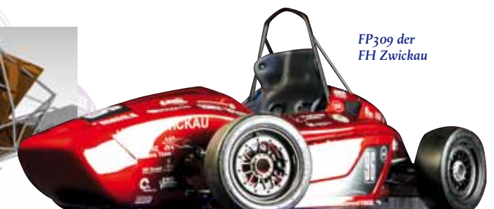
FP309 der FH Zwickau

Während für 2009 der Schwerpunkt darauf lag, den Wagen so leicht wie möglich zu gestalten, ist ihr Entwicklungsziel für die Saison 2010, die Zuverlässigkeit zu erhöhen. Deshalb wird zum Beispiel der Vierzylinder-Hondamotor auf Nasssumpfschmierung umgerüstet. Dazu Kay Stüllein: „Trockensumpfschmierung ermöglicht zwar einen tieferen Fahrzeug-Schwerpunkt, bedeutet aber einen hohen Aufwand für Verschlauchung. Je mehr Teile Sie im Auto