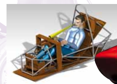
Ergonomieuntersuchung mit CATIA-Human Builder

die Studenten die Angaben in CATIA DMU-Kinematics auf Kollisionsfreiheit. Bei der Getriebe-Neuentwicklung für den FP309 visualisierten sie mit demselben Tool außerdem einen kompletten Schaltzyklus.